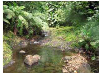
Lit de la Rivière Lézarde à remonter