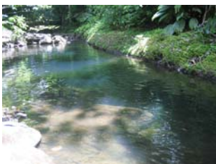
Premier bassin de la Lézarde

ATTENTION : très médiatisé, zone petite et prisée