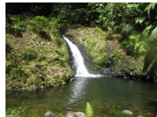
Cascade finale de la Lézarde