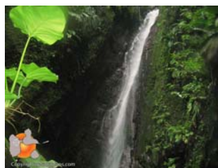
Petite cascade pour les aventuriers