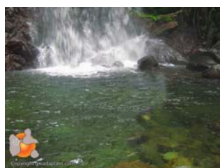
Bassin en bas des chutes