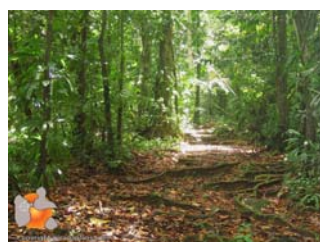
Sentier parsemé de racines