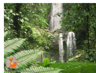
En approche des Chutes Moreaux