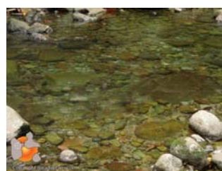
Traversées de rivière