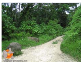
Départ depuis le parking