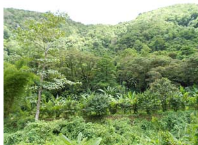
Jardins créoles le long du chemin

5. En face, redescendre sur une vingtaine de mètres le long des roches et prendre le chemin à gauche. La cascade est bout de ce chemin, environ 10 minutes de marche. Bonne baignade !