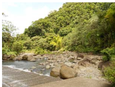
Traversée de la Grand-Rivière au niveau de la Prise d'eau