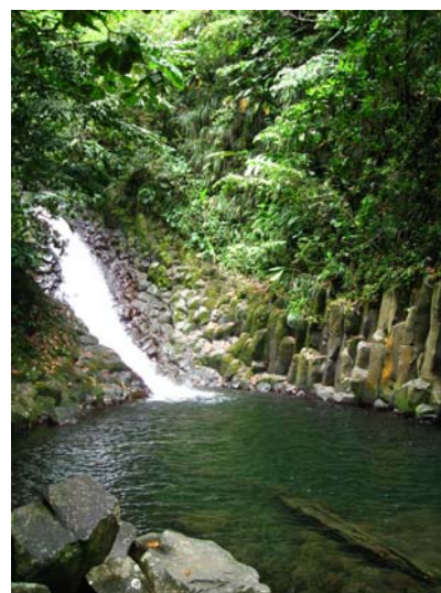
Cascade et bassin de la Ravine Paradis