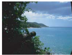
Grand Bas Vent