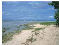
Caye en bord de mer