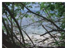
Mangrove en bord de mer