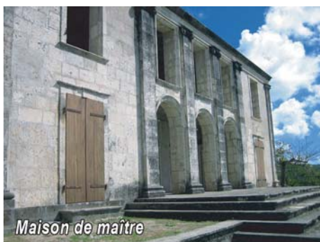
Maison de maître