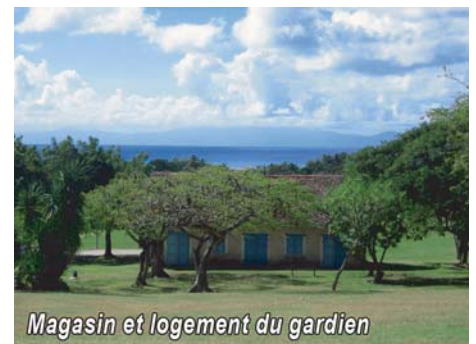
Magasin et logement du gardien

Le domaine s'étendait sur 200 hectares et employaient 300 esclaves. Aujourd'hui, c'est un écomusée dédié à la vie de l'époque.