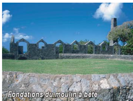
Fondations du moulin à bête